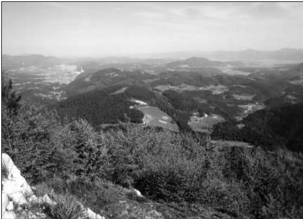
Figure 3: Hills of Ložnica between the Velenje Basin (left) and the Savinja Valley (photo taken from the west). In the lower picture is a belt of higher hills west of the Paka gorge Penk. To the left is the straight tectonic dislocation of Šoštanj in the Velenje Basin where 1000 m deep Pliocene and Quaternary sediments accumulated, between them also 160 m thick seam of lignite. Seen are towns of Šoštanj and Velenje, close to the left border of the picture are wooded hills built of Pleistocene sandy and silty sediments. From the distance the level top ridges seem to be equally high, but at the closer examination the considerable height differences make the assessment of the primary and secondary top levels on the ridges questionable.

Slika 3: Ložniško gričevje med Velenjsko kotlino (levo) in Savinjsko dolino, slikano od zahoda, od Belih vod. Spodaj je pas nizkih hribov zahodno od paške soteske Penk. Levo od ravne Šoštanjske prelomnice izstopa neotektonska Velenjska kotlina, kjer je odloženih 1000 m pliocenskih in kvartarnih sedimentov, med njimi 160 m debela plast lignita. Vidna sta Šoštanj in Velenje, bliže roba fotografije pa gozdnato gričevje iz pleistocenskih nesprijetih, peščenih in meljnatih sedimentov. Gričevje je videti od daleč, da je podobnih višin, v drobnem pa so med vrhovi oblih slemen tolikšne razlike, da je ugotavljanje enotnega nivoja in nižjih slemenskih nivojev nesigurno.