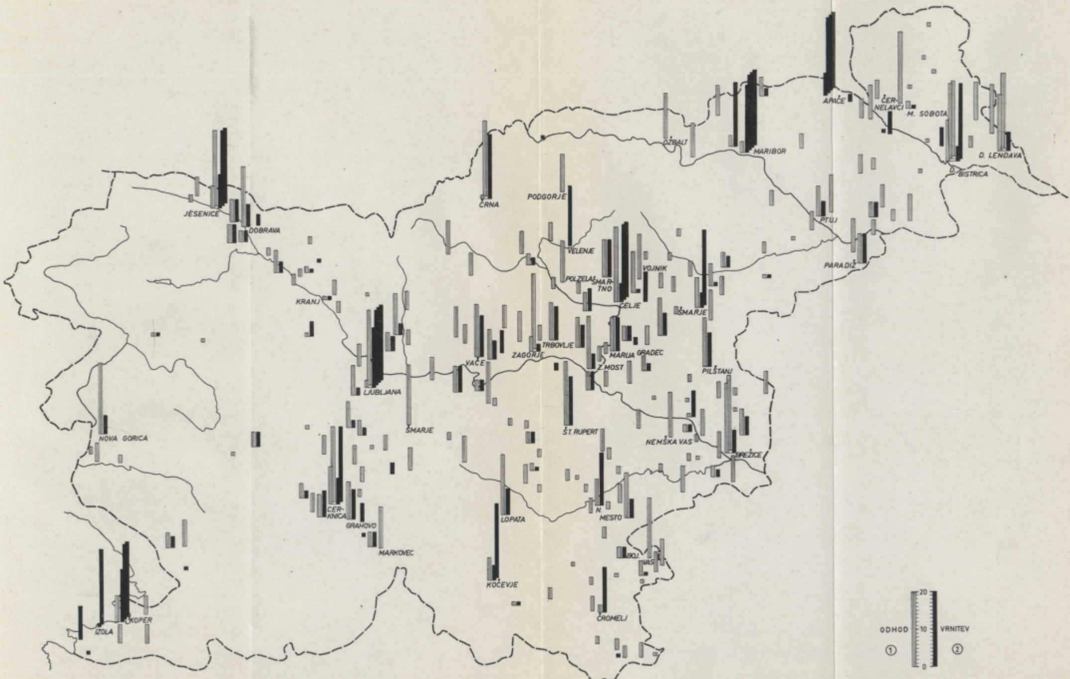
Pregled krajev izselitve kolonistov v Banat in vrnitve v Slovenijo