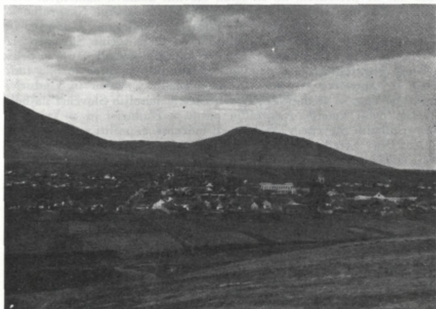
Slika 2. Gudurica, v ozadju Vršačke planine

V 4-mesečnem obdobju od 24. novembra 1945 do 10. marca 1946 je prišlo v Veliko Gredo vsega skupaj 99 družin s 395 člani.