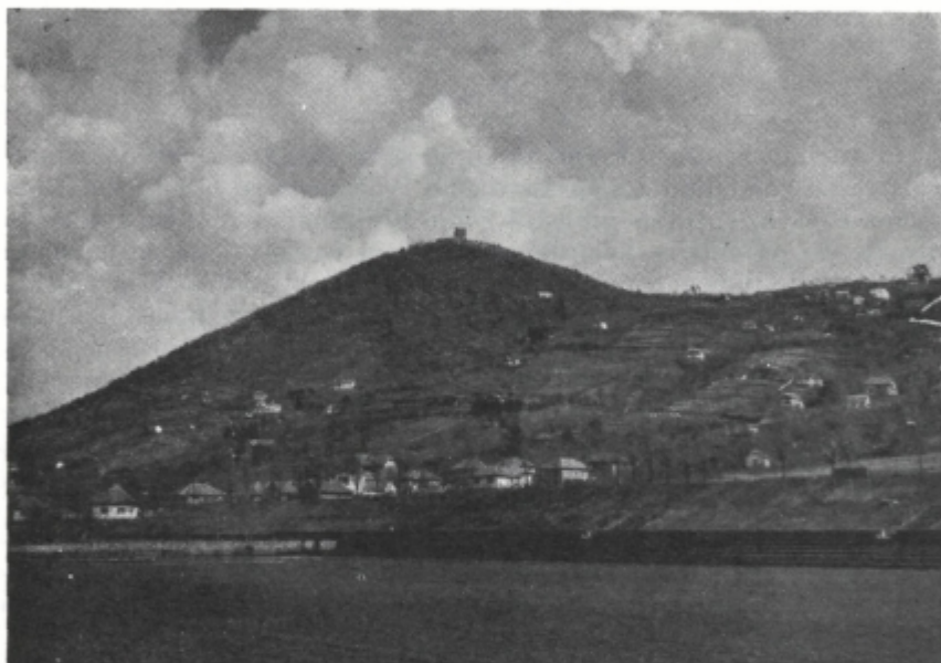
Slika 1. Vršačka kula, začetek Vršačkih planin nad Vrščem

Aluvialne ravnice so iz različnega materiala. V Malem Vršačkem Ritu je aluvij iz glinastih in peščenih sedimentov, ki so prekriti z novimi nanosi, katere so nanесли potoki z Vršačkih planin. V Alibunarsko-Vršački nižini, z nadmorsko višino 75–78 m, pa sestavlja