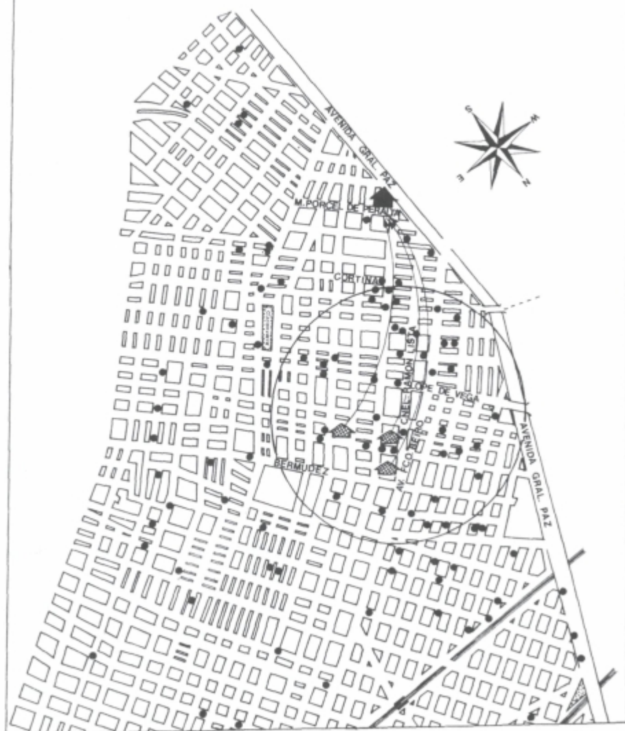
Slika 1: ETNIČNA NASELJINA SKUPNOSTI PREDVOJNIH SLOVENSКИH PRISELJENCEV V VILLI DEVOTO Fig. 1: THE ETHNIC SETTLEMENT OF THE COMMUNITY OF PRE-WAR SLOVENE IMMIGRANTS IN VILLA DEVOTO