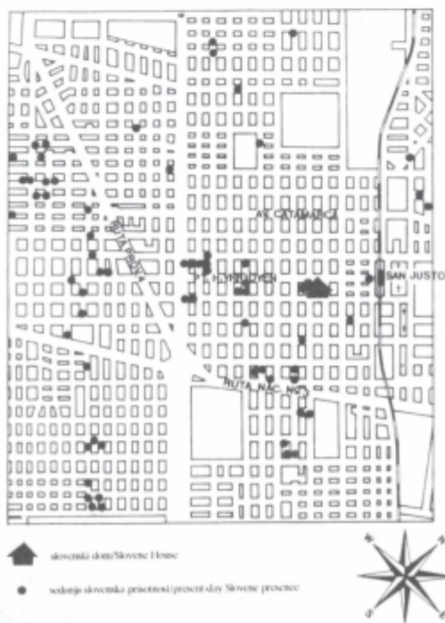
Slika 2: ETNIČNA NASELJENINA SKUPNOSTI POVOJNINI SLOVENSKE PRISeljENCEV V SAN JUSTU Fig. 2: THE ETHNIC SETTLEMENT OF THE COMMUNITY OF POST-WAR SLOVENE IMMIGRANTS IN SAN JUSTO

Nakupovanje lastnih gradbenih parcel je bilo usmerjeno v neposredno zaledje središča San Justa. Tu so se zbirali Slovenci ob nedeljah, potem ko je bilo spričo vse številčnejše prisotnosti uvedeno v farni cerkvi tudi slovensko bogoslužje. Stanovanjska gradnja koncem štiridesetih in v začetku petdesetih let se je odvijala predvsem južno od sanhuškega središča ob cesti Hipolito Yrigoyen in njenih vzporednicah ter južnejše od Almafuerte ob glavnih prometnicah, ki povezujejo območje z glavnim mestom. Manjši poselitveni center se je osnoval še v Tabladi, vendar pripada san-