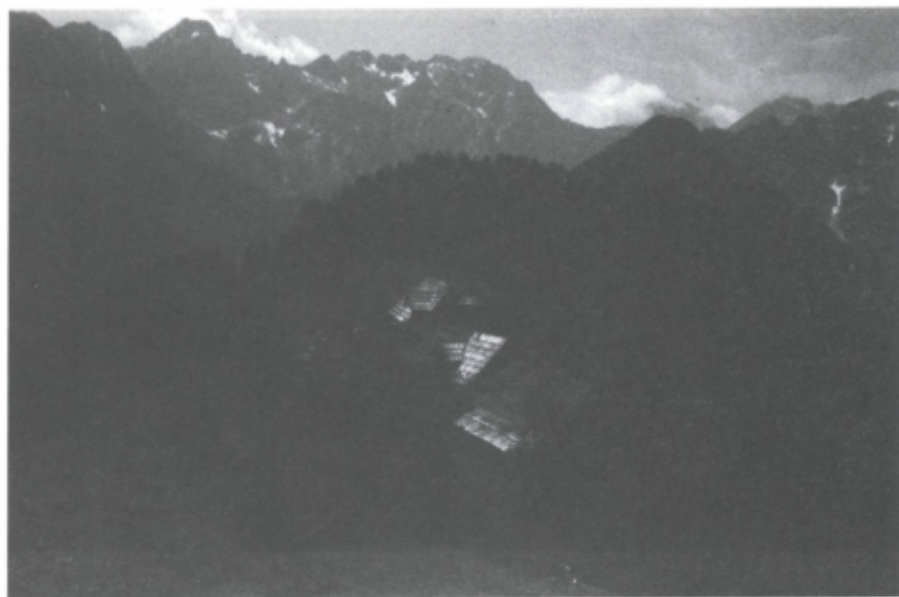
Demografsko ogroženo obmejno območje - primer Solčavsko Demographically endangered border area - case of Solčavsko

ma predlagatelji regionalnih razvojnih programov in državo opredeliti s pogodbo, ki bi točno opredelila obveznosti obeh partnerjev. Takšna oblika bi zahtevala že predhodno večkrat omenjeno potrebo po znani razvojni strategiji Slovenije, s tem pa bi bili dani temelji za interesno povezovanje, tako na podjetniški kot lokalno samoupravni ravni (nove občine in pokrajine). Država bi s tem pridobila možnost bolj preglednega vodenja regionalne politike in njenih učinkov, poleg tega pa bi se v večji meri izognili možnim očitkom o favoriziranju posameznih območij v Sloveniji. Menimo, da le na takšnih temeljih lahko pričakujemo uspešno uveljavljanje regionalne politike tudi v Sloveniji.