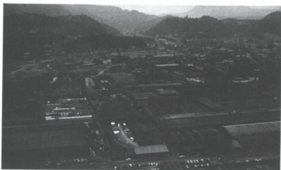
Stara industrijska središča - primer Celja