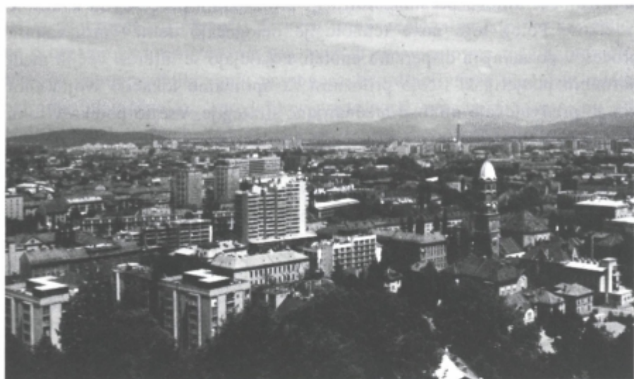
Urbana aglomeracija - primer Ljubljana Urban agglomeration - case of Ljubljana

Podeželska območja predstavljajo glede na različno prevlado ruralnih ali suburbanih elementov morda najbolj občutljivo območje poseganja regionalne politike. Pomembna je opredelitev območij prednostno namenjenih kmetijstvu, kjer bo poleg uvajanja ekološko sprejemljivih agromelioracijskih posegov potrebno izvajati programe prenove vasi. Ti programi bodo usmerjeni tudi skozi oblikovanje arhitekturne identitete slovenskih pokrajin. Območja suburbanizacije velja usmerjati v izboljšave kvalitete bivanja, jasnejšo opredelitev funkcije znotraj teh območij (bivalna, obrtna, storitvena) ter sanacijo oblikovne podobe pokrajine, z opredelitvijo sprejemljive gostote pozidave.