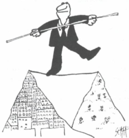
Quo vadis Slovenia